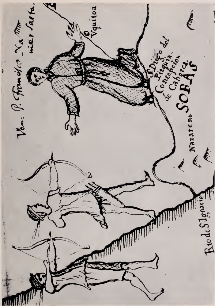
Muerte del Padre Saeta.